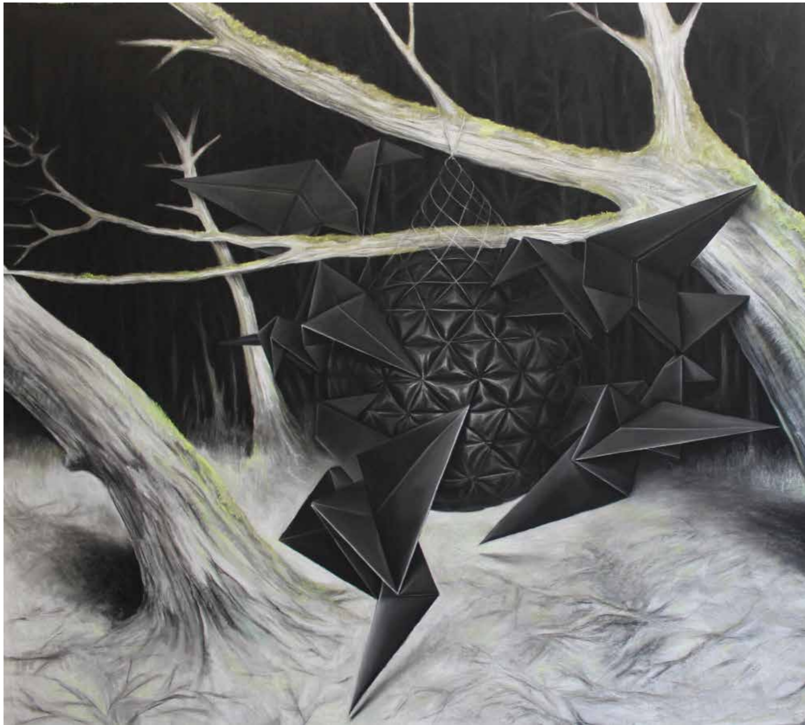
Karolína Netolická, Lojová koule/Tallow Ball, 240x220 cm, 2019