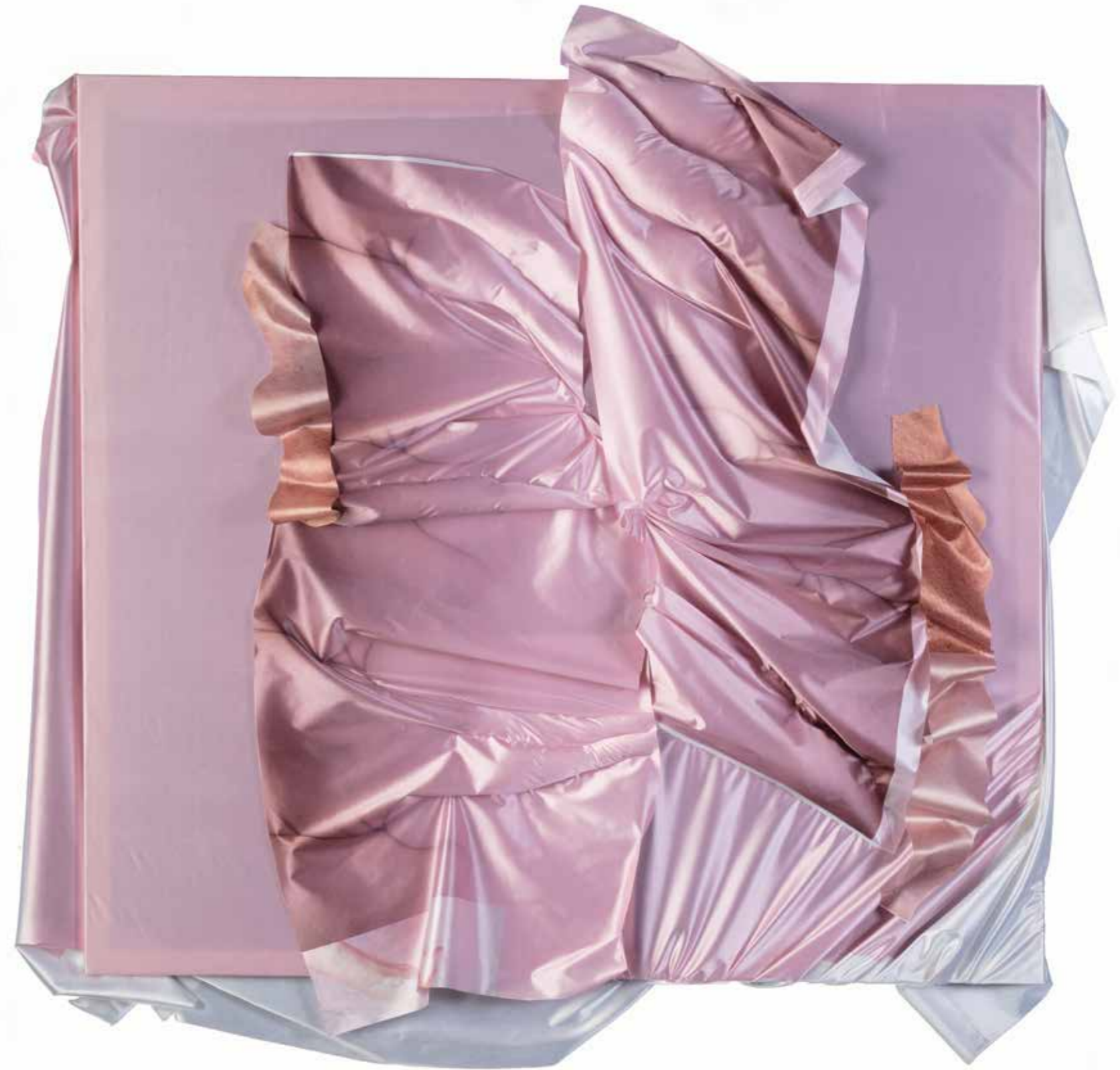
Lucie Králíková, Sáhni/Touch, 150x160 cm, 2019